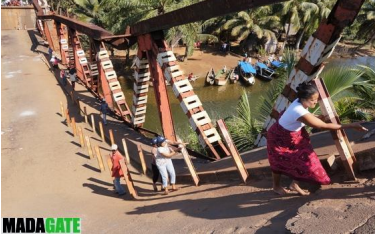
Un chef d'une famille veut aller enterrer un récent défunt, de l'autre côté de la ville