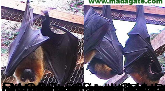
Les chauves-souris de Madagascar (Pteropus) sont en danger d'extinction