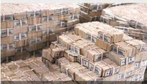
Sherritt / Ambatovy : ènième tentative de